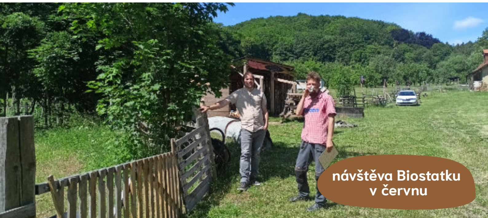
návštěva Biostatku v červnu